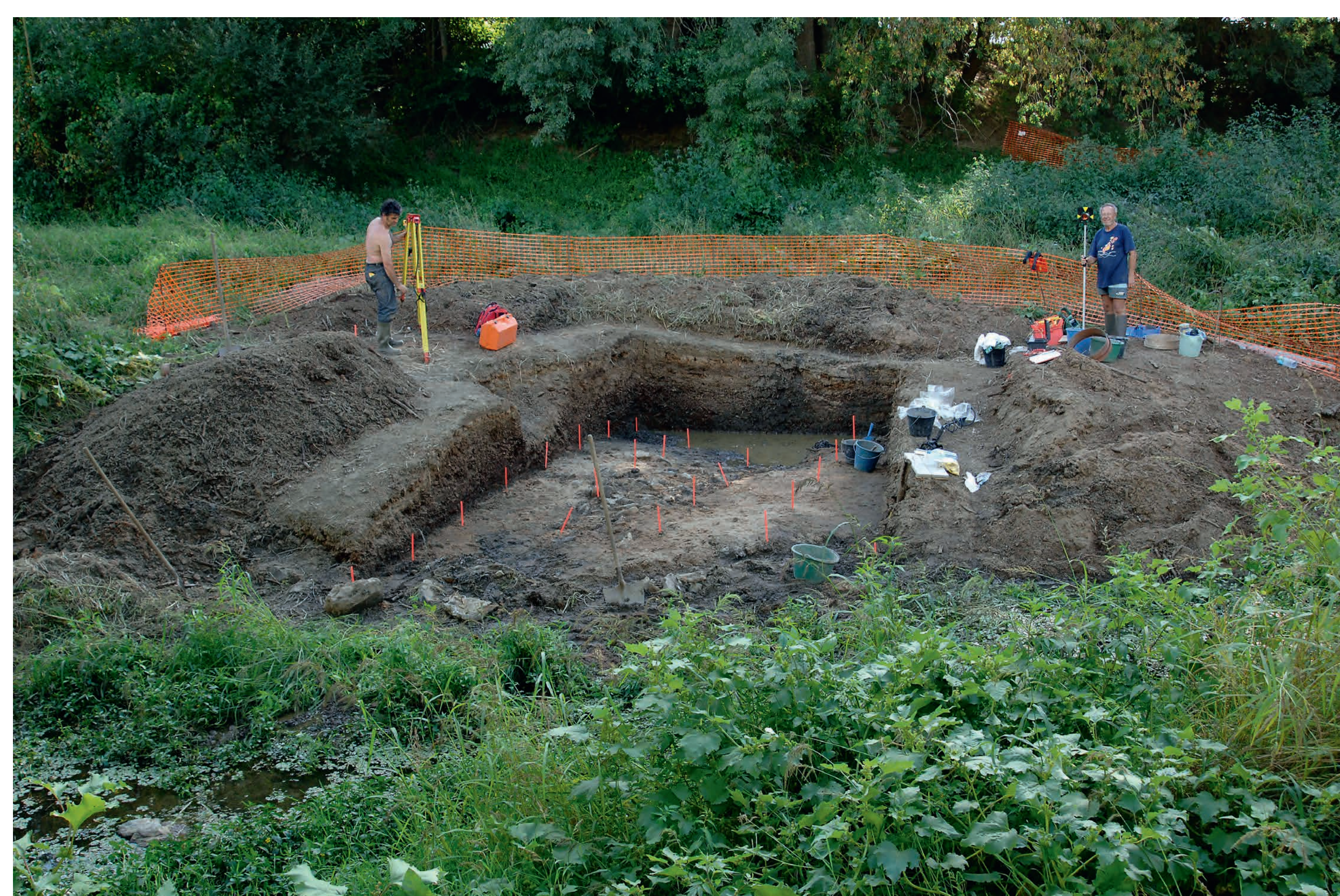
Campagne 2006 et 2007 - Un important travail de décapage est nécessaire pour accéder au niveau archéologique. La découverte de matériel fait l'objet de relevés systématiques.