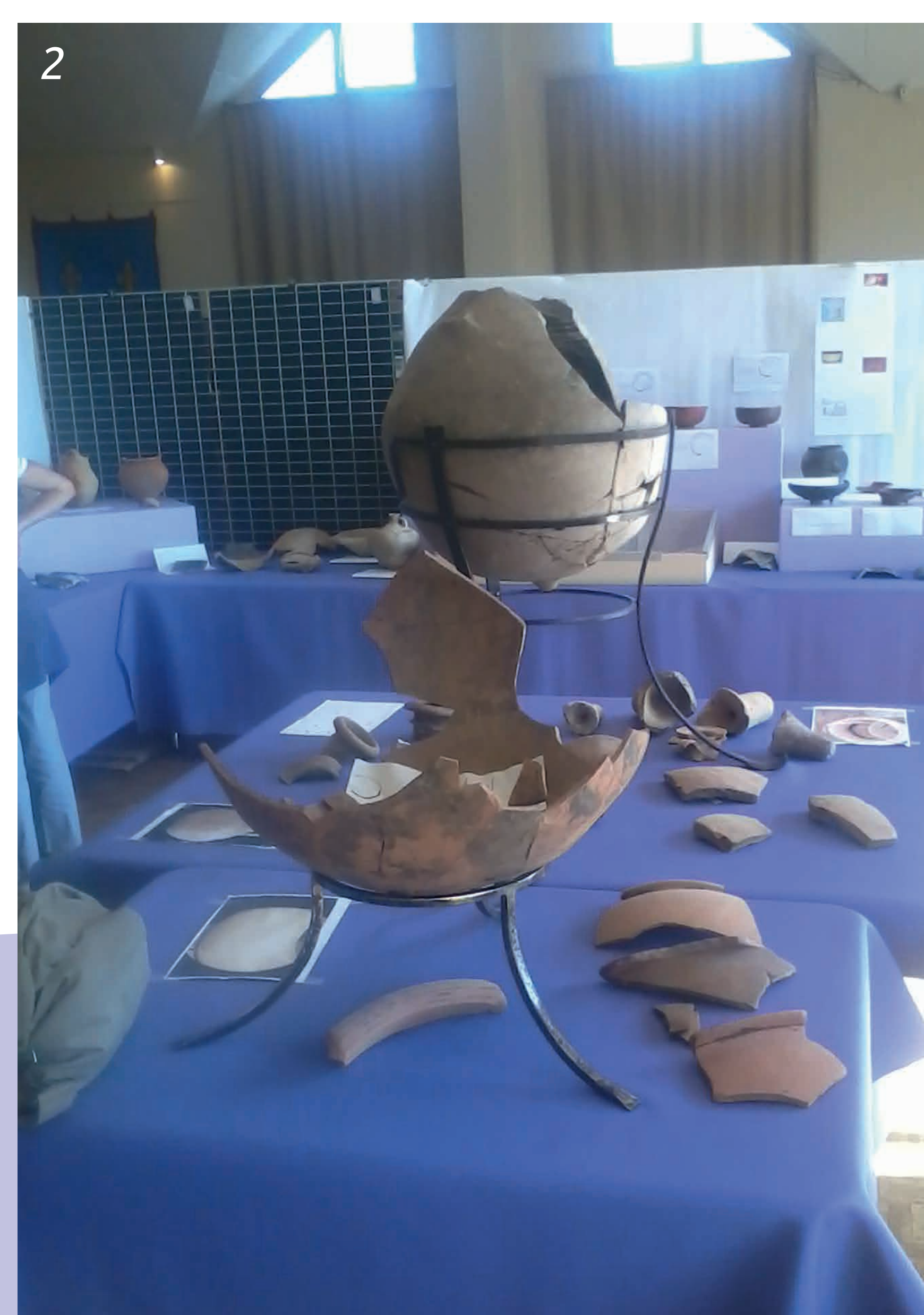
1- Exposition à Notre-Dame-du-Maillais.